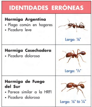
Imágenes de hormigas